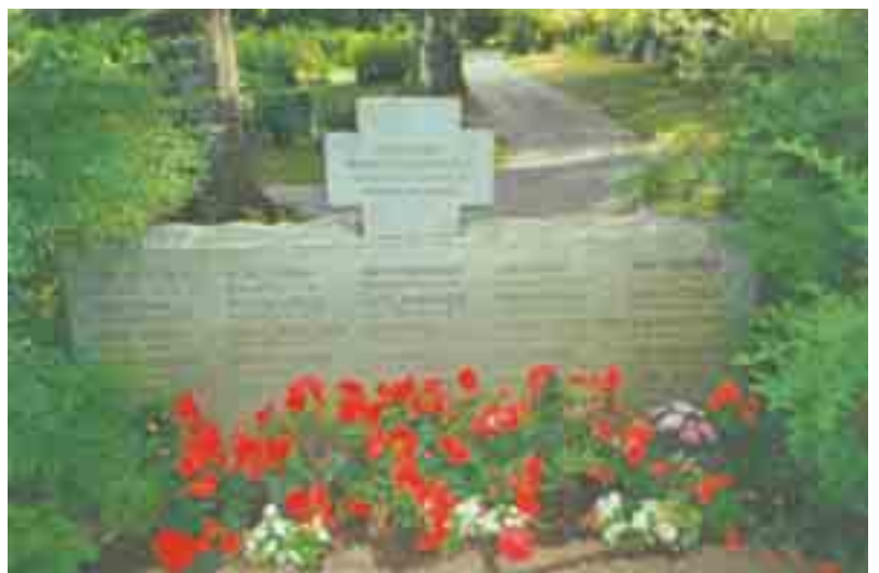
Muistomerkki kertoo 60 hiitolaisen evakkomatkan päättämisestä Kankaanpäässä.

Karjala-lehdessä on syksyn aikana kysely eri pitäjien evakkoajan yhteisiä hautamuistomerkkejä. Kaikki hiitolaisetkaan eivät ehkä tiedä, että Kankaanpään hautausmaalle on pystytetty ensimmäisinä evakkovuosina sinne haudattujen hiitolaisten yhteinen muistomerkki.