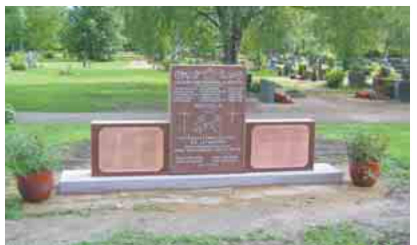
Käkisalmlaisten jälkeen on hautausmaahan muistomerkkin mukaan eniten haudattu kurkijokelaisia. Myös yksi hiitolainen on Ylistaroon vuosina 1941-44 haudattu.