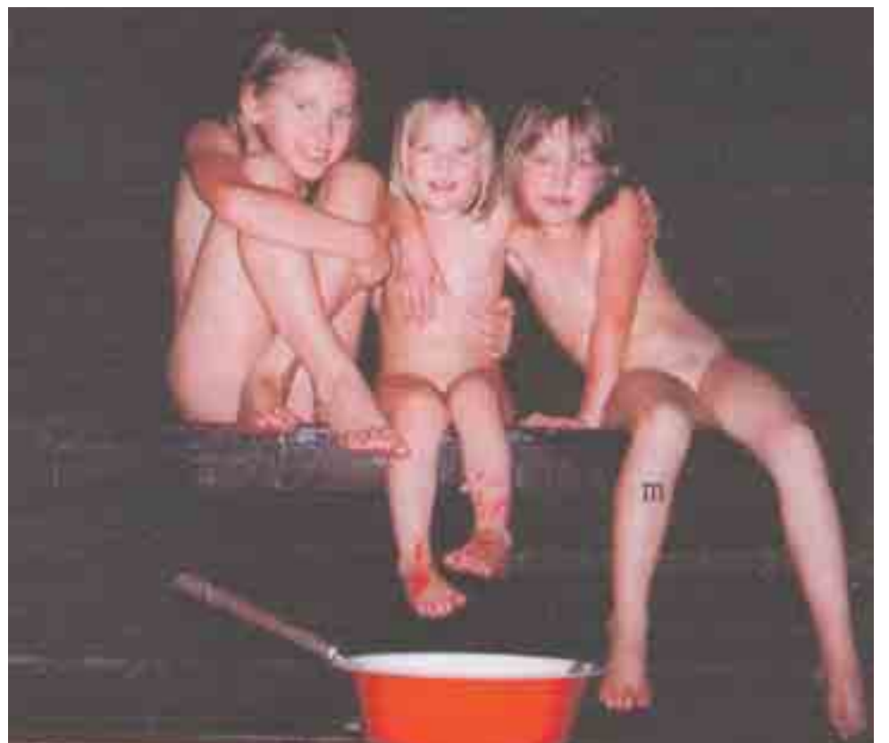
Pinja, Peppiina ja Petrastiina lähtivät tutkimaan, löytyisikö mummon savusaunasta saunatonnttua.