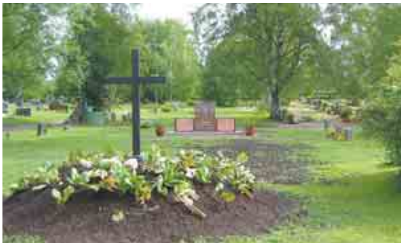
Ylistarolla on laitettu Karjalasta lähtemään joutuneiden ja paikkakunnalla kuolleiden evakkojen hauta kauniiksi – osittain karjalaisten säätiöiden tuella. Myös Kurkijoki-Säätiö oli hankkeessa mukana.