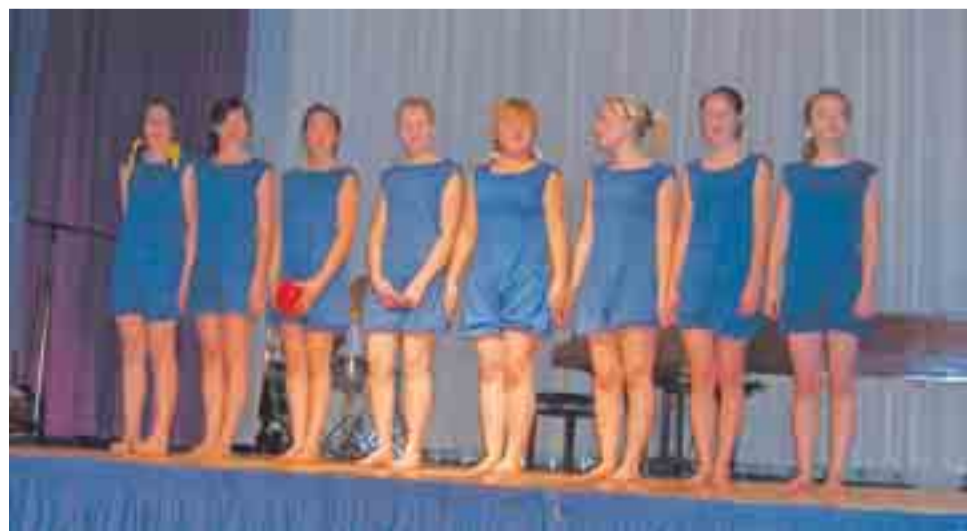
”A-sonaatti kahteen ääneen...” eli ajankuvia koulunkäynnin arjesta eri vuosikymmenten varrelta. Tässä 1950-luvulta tyttöjen voimistelutunti. Opettajalla oli tamburiini, ja kaikki näytti kovin tutulta myös 1960-luvulla koulua käyneen mielestä.