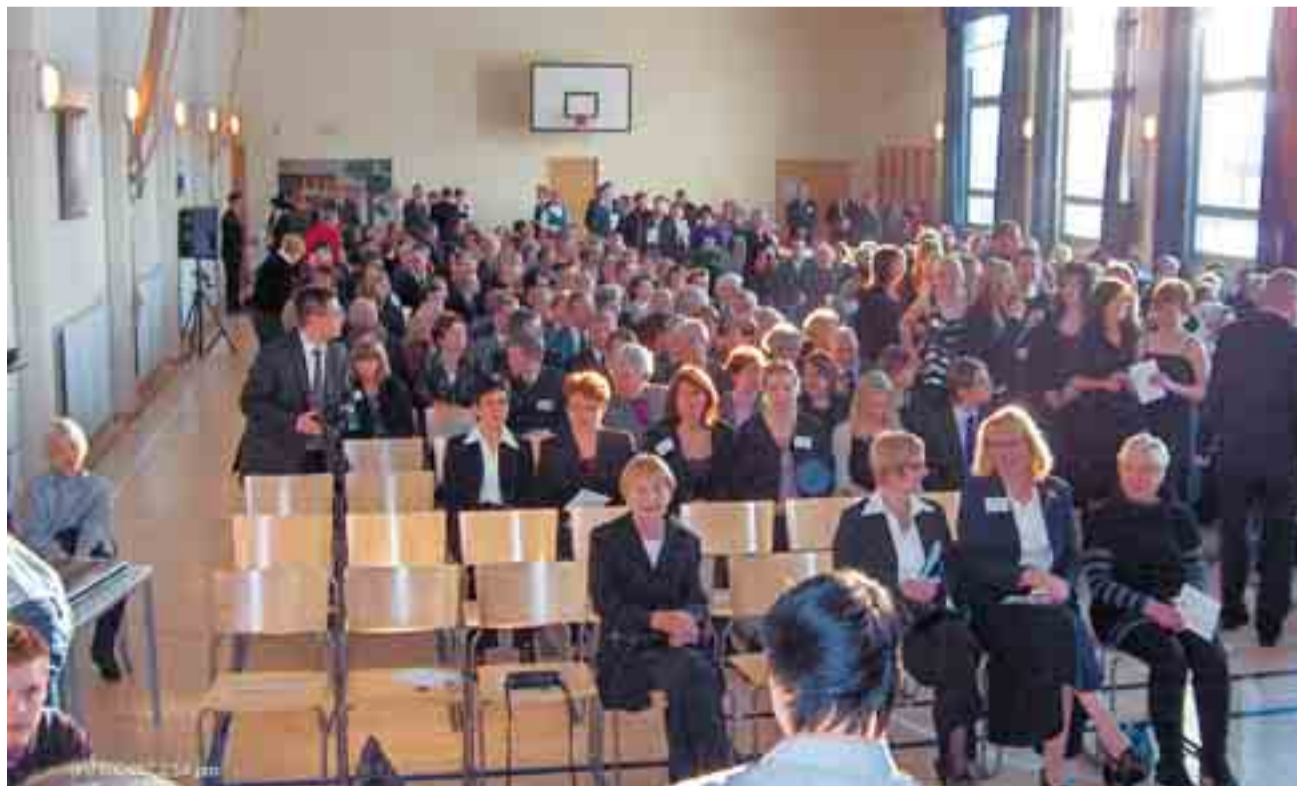
Elisenvaaran koulun 80-vuotisjuhla oli yleisömenestys. Sekä päiväjuhlaan että juhlaillalliselle saapui kumpaankin noin 240 juhlijaa. Kuva on otettu vähän ennen päiväjuhlan alkamista.

Toivotan teille omasta puolestani miellyttäviä muistelu- ja keskustelutaukoja entisten luokkatoverien kanssa.