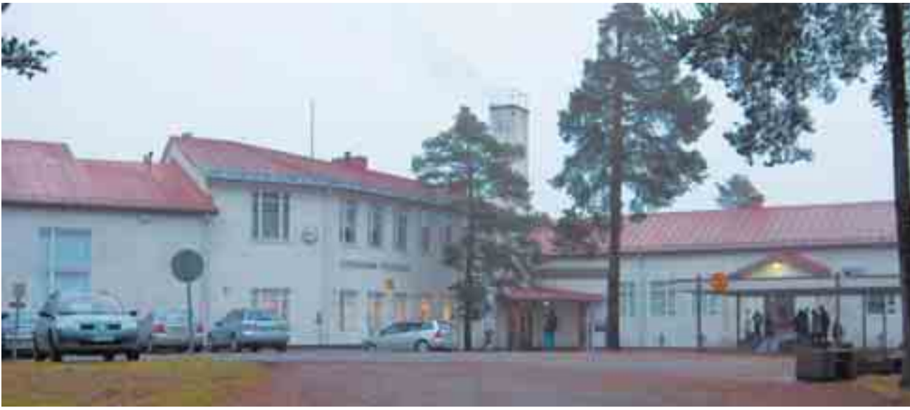
Elisenvaaran yhteiskoulu nykyasussaan eräänä sumuisena aamuna.