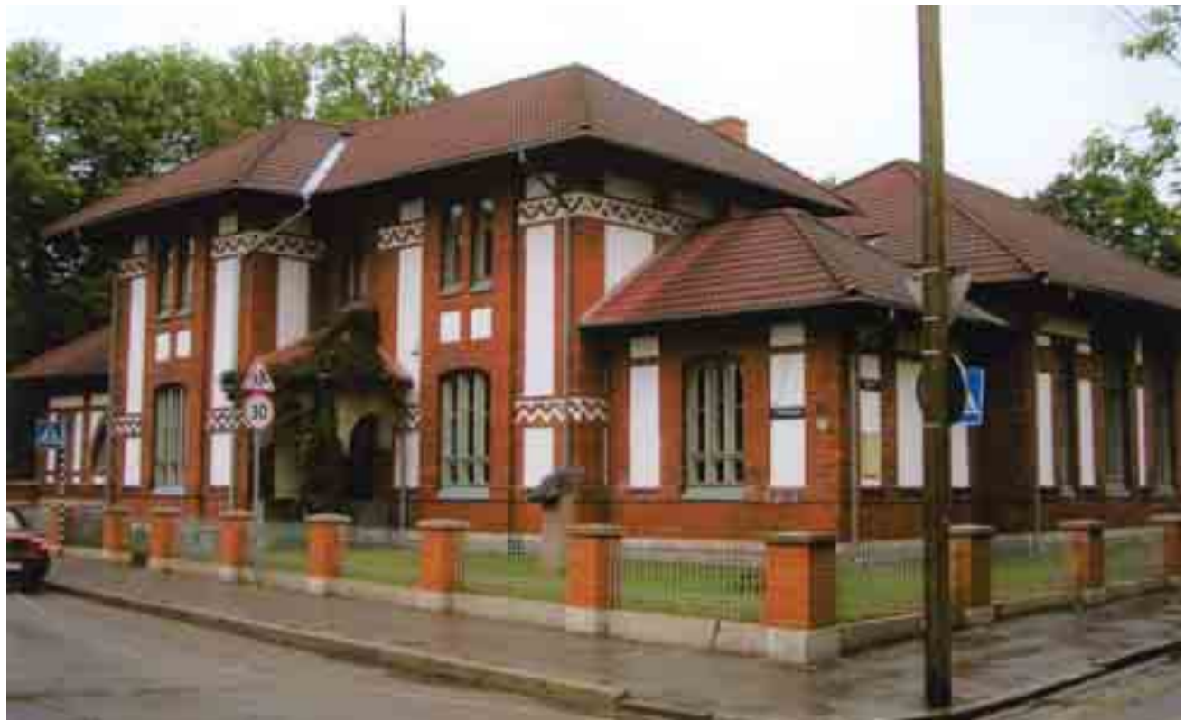
Tässä talossa solmittiin Tarton rauha 14.10.1920. Pihalla olevassa muistopaadessa kerrotaan tuosta historiallisesta hetkestä. Kuva on otettu kesäkuussa 2008.

Maamme kehittyi vauhdilla itsenäisyyden alkuaikoina. Teollisuus ja kauppa alkoivat kukoistaa. Maamme silloinen johto oli tuudittautunut liikaa hyökkäämättömyyssopimuksen mukanaan tuomaan ”onnelliseen oloilaan”, koska jätti puolustus-