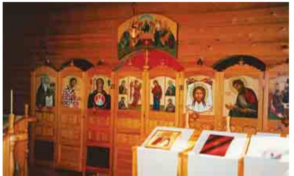
Nellimin ortodoksinen kirkko on vihitty vuonna 1987 rukoushuoneeksi ja vuonna 1988 kirkoksi. Erittäin kaunis kirkko on kaikkien kirkkokuntien käytössä. Nellimissä asuu inarinsaamelaisia, kolttsaamelaisia ja suomalaisia, joten kylää kutsutaan myös kolmen kulttuurin kyläksi.