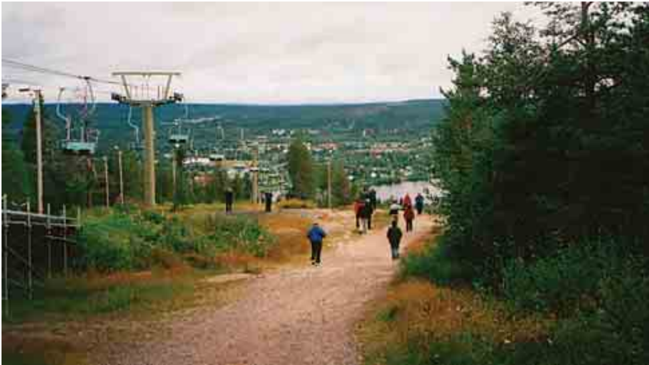
Rovaniemen kaupunkiin on hyvät näkymät Ounastunturin laelta.