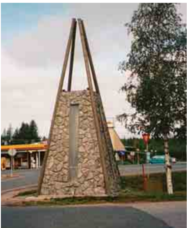
Napapiirillä sijaitsee muistomerkki, joka on pystytetty venäläisten partisaanien uhreille.