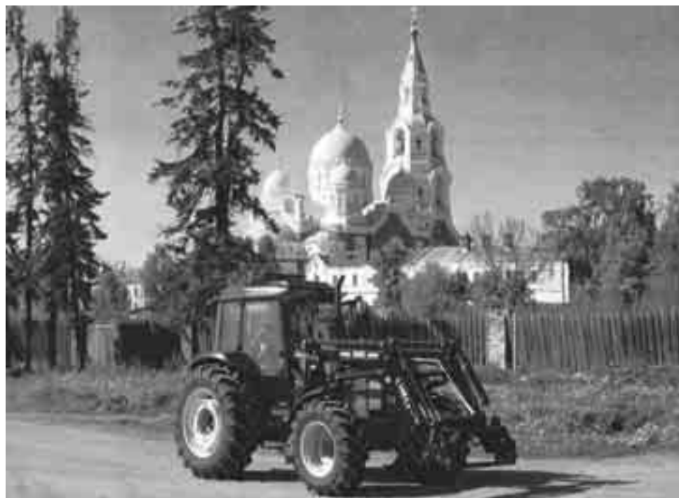
Suomalaisten tietotaitoa ja konkreettista kehitysapua on viety Valamon luostarisaarelle jo yli 10 vuoden ajan. Lahjoituksena kansalaiskeräyksen kautta saatu, runsain lisälaittein varustettu, uusi traktori Valtra A85 luovutettiin Valamon luostarille 28.2.2005 Valtra Oy:n traktoreita.

Venäjän ortodoksisen kirkon Moskovan patriarkaattiin