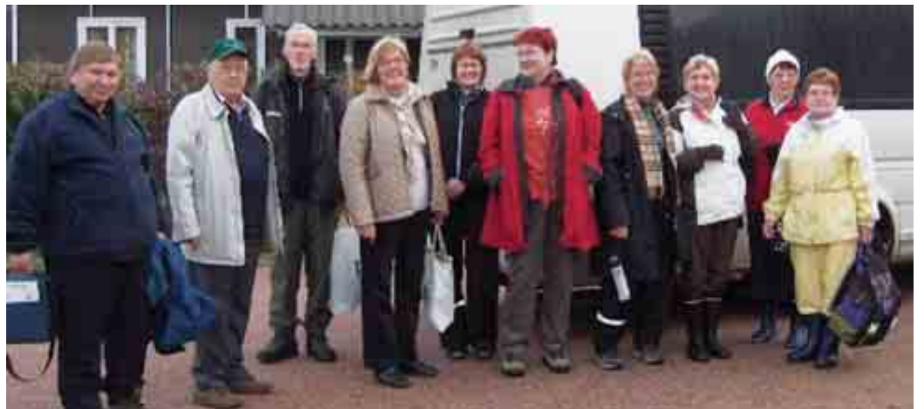
Iloisia matkalaisia, suuntana Hiitola.