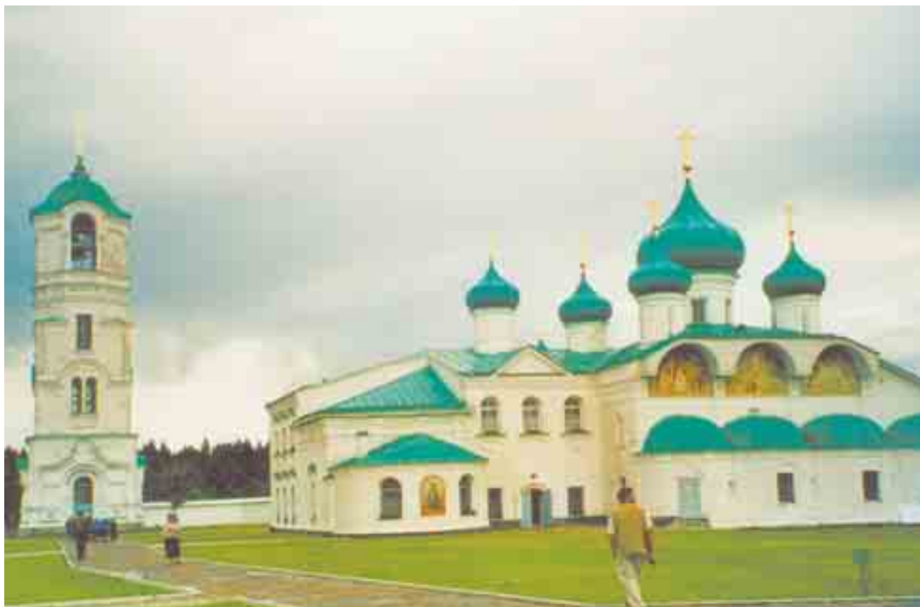
Eräs Syvärin luostarin kirkoista.