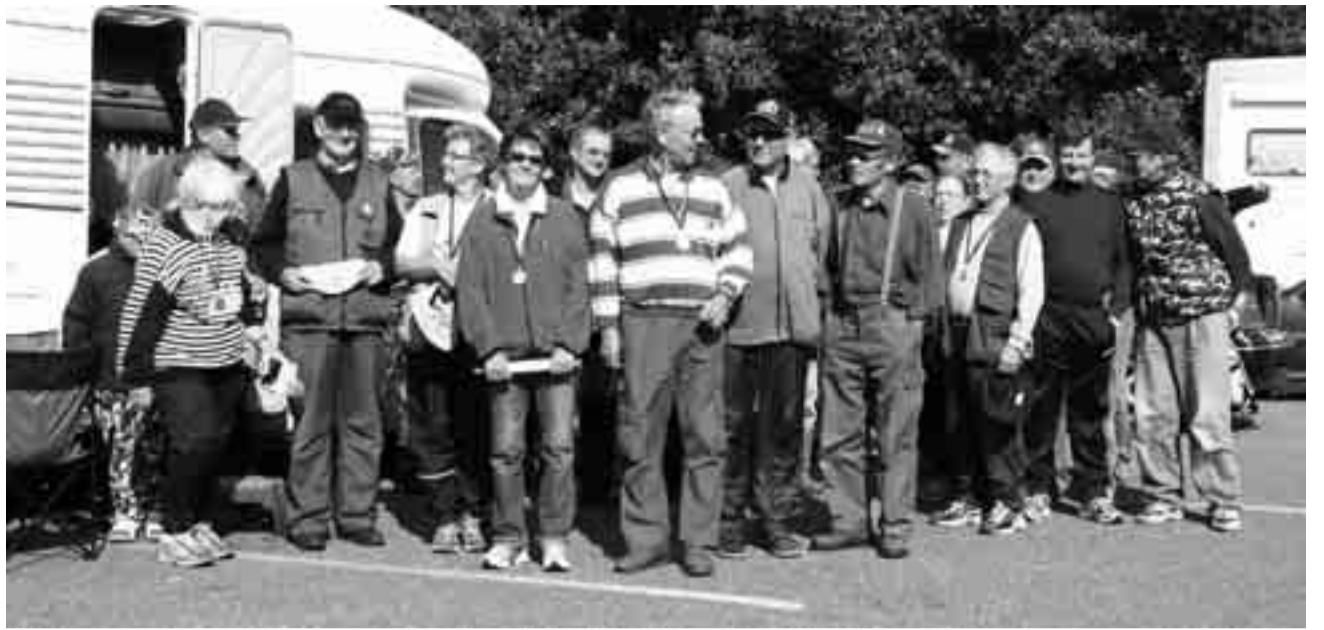
Kilpailuun osallistuneet ja etenkin jotain voittaneet onkijat loistivat kilpaa auringon kanssa Revaskerin sillan töyräällä.