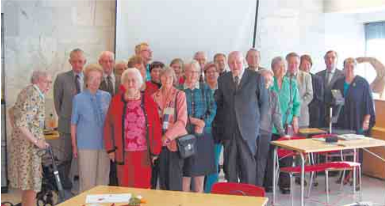
Elisenvaaran koulun entiset oppilaat kokoontuivat Karjalatalolla Helsingissä yhteispotrettiin tapaamisen päätteeksi lauantaina 1.9.