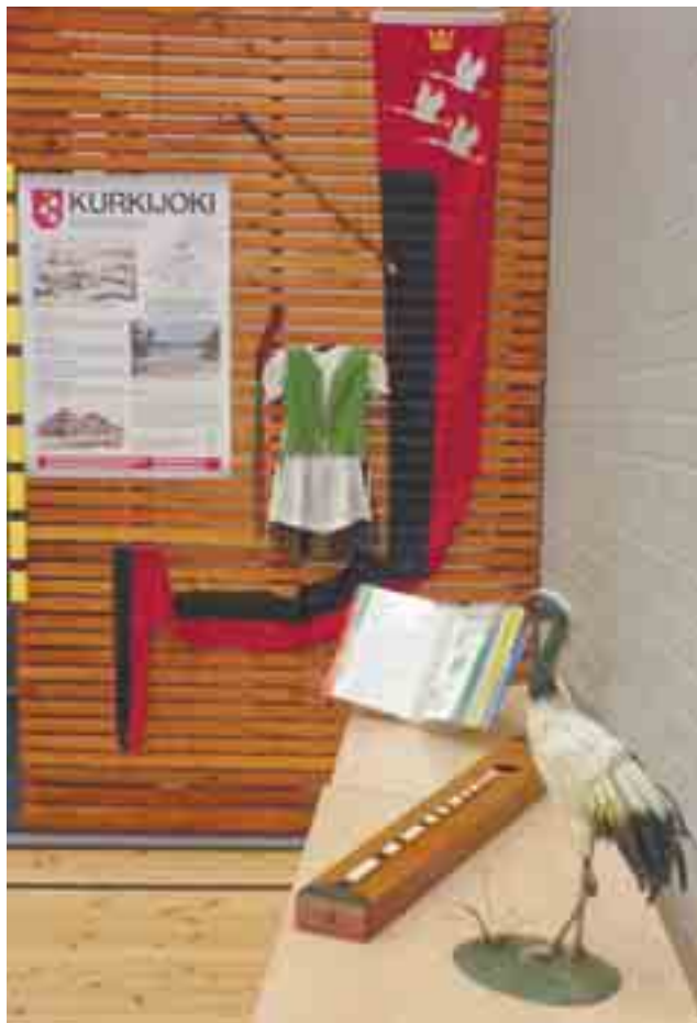
Karjalan Liiton pitäjämessuilla Kurkijoen osastoa koristeineet esineet oli tuotu näytteille myös Kurkijokelaisten pitäjäjuhlilla.

Juhlapuhe Hiitola-säätiön 60-vuotisjuhlassa ja Hiitolan Pitäjäseura ry:n 40-vuotisjuhlassa Porissa 5.8.2007.