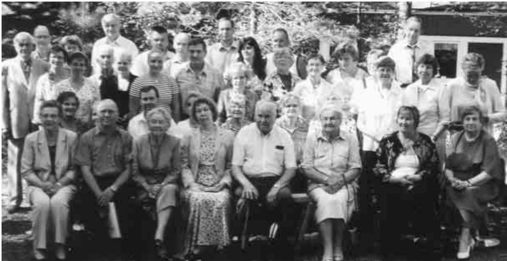
Hämmäläiset sukutapaamisensa kunniaksi ryhmäkuvaan kokoontuneina Loimaan Veteraanituvan kaukuilla pihamaalla.