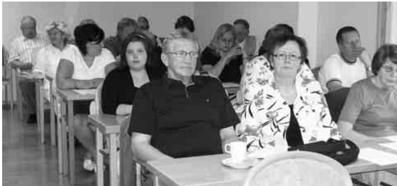
Uimosen sukuseuralaisia kokouksen kulkua seuraamassa.