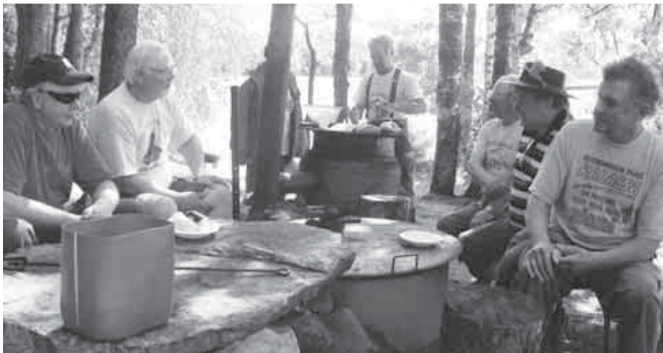
Kalastajapoppoo rauhallisena pöytäkiiven ympärillä maittavan kalasopan syötyään.