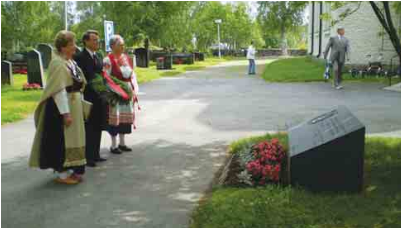
Seppleen laskijat Viipurin läänin pyhäjärveläisten vainajien muistomerkillä Alavuden kirkkomaalla Lumi-Säätiön 60-vuotisjuhlapäivänä.