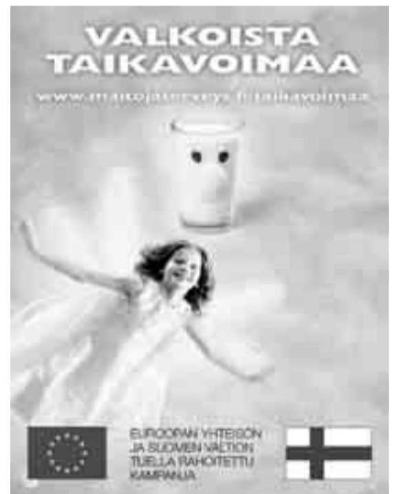
80 % suomalaisten kalsiumin saannista on peräisin maitovalmisteista.