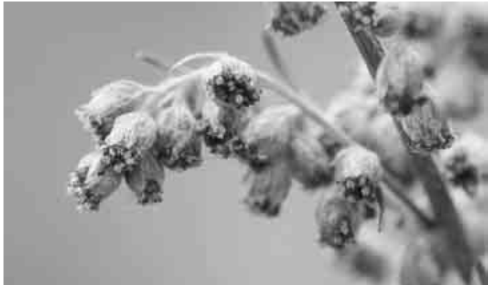
Pujon kukkiessa mykeröiden kärjistä pistävät esiin keltaiset kehrä- ja laitakukat. Jokaisen mykerön sisällä on noin 15 eri kehitysvaiheessa olevaa kehräkukkaa.

tutkittiin tarkemmin pujokasvustojen tuntumassa tehdyillä mittauksilla. Allergisten onneksi pujon siitepöly leviää heikosti. Kasvuston reunalla pitoisuus laskee puoleen jo 10 metrin matkalla. Pujopaikalla havaittiin pahimmillaan 3000 hiukkasta ilmakehässä, kun kauempana pitoisuudet jäivät tavallisesti vain joihinkin kymmeneen.