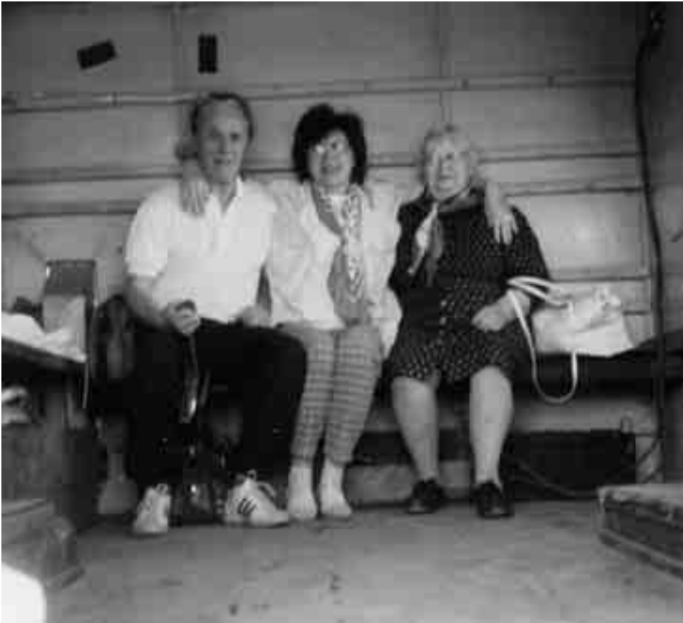
1. Matka: istumme maastoauton lavakopissa ja olo on jännittynyt, matka Löyhkölään on edessä.