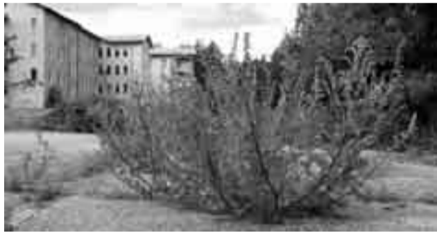
Pujo alkaa helposti kasvamaan mm. asfaltin raosta