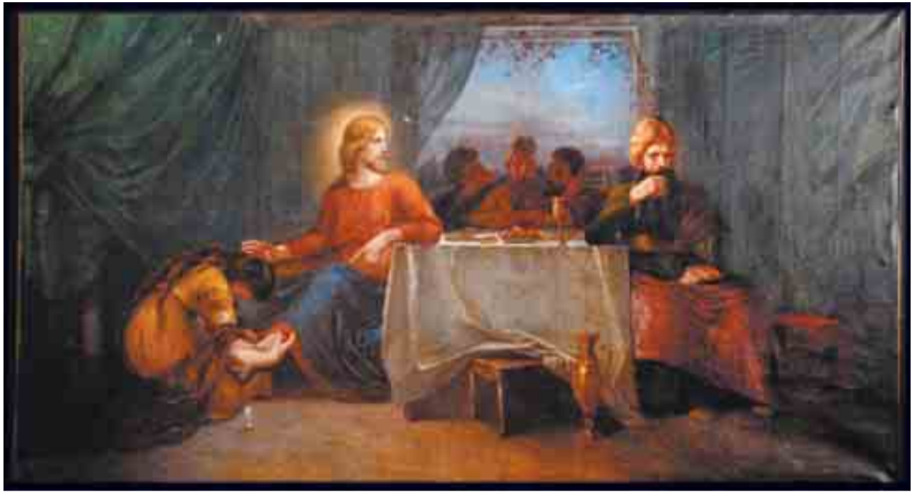
Kurkijoen kirkon alttaritaulun maalasi 1884 Aleksanda Sältin Turussa. Sältinin töitä oli Hiitolassa ja muissakin Kannaksen kirkoissa. Loimaan kirkon seurakuntasalissa oleva alttaritaulu kuvaa Jeesusta ja syntistä naista, joka pesee Jeesuksen jalat ja kuivaa ne hiuksiinsa.

Pitäjäjuhla alkaa Yhteiskoululla elokuvaesityksellä klo 13. Se on Illumine Oy:n (ks. Kurkijokelainen n:o 8/2007) tuottama dokument-