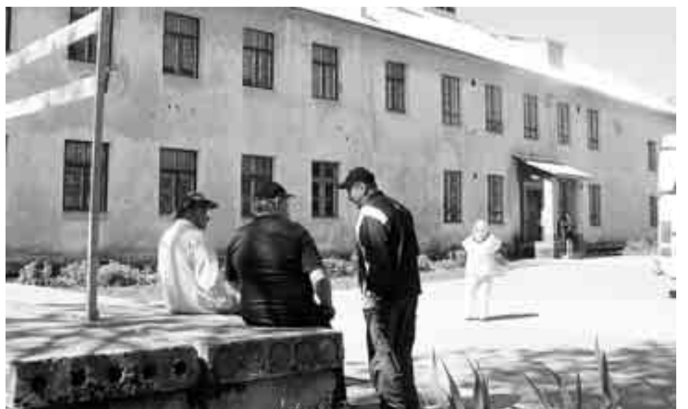
Tältä näyttää entinen Suohovin koulu, jossa nykyisin toimii Elisenvaaran ainoa koulu.

Kuvat ja teksti : Kaarina Pärssinen (Pyhäjärveltä)