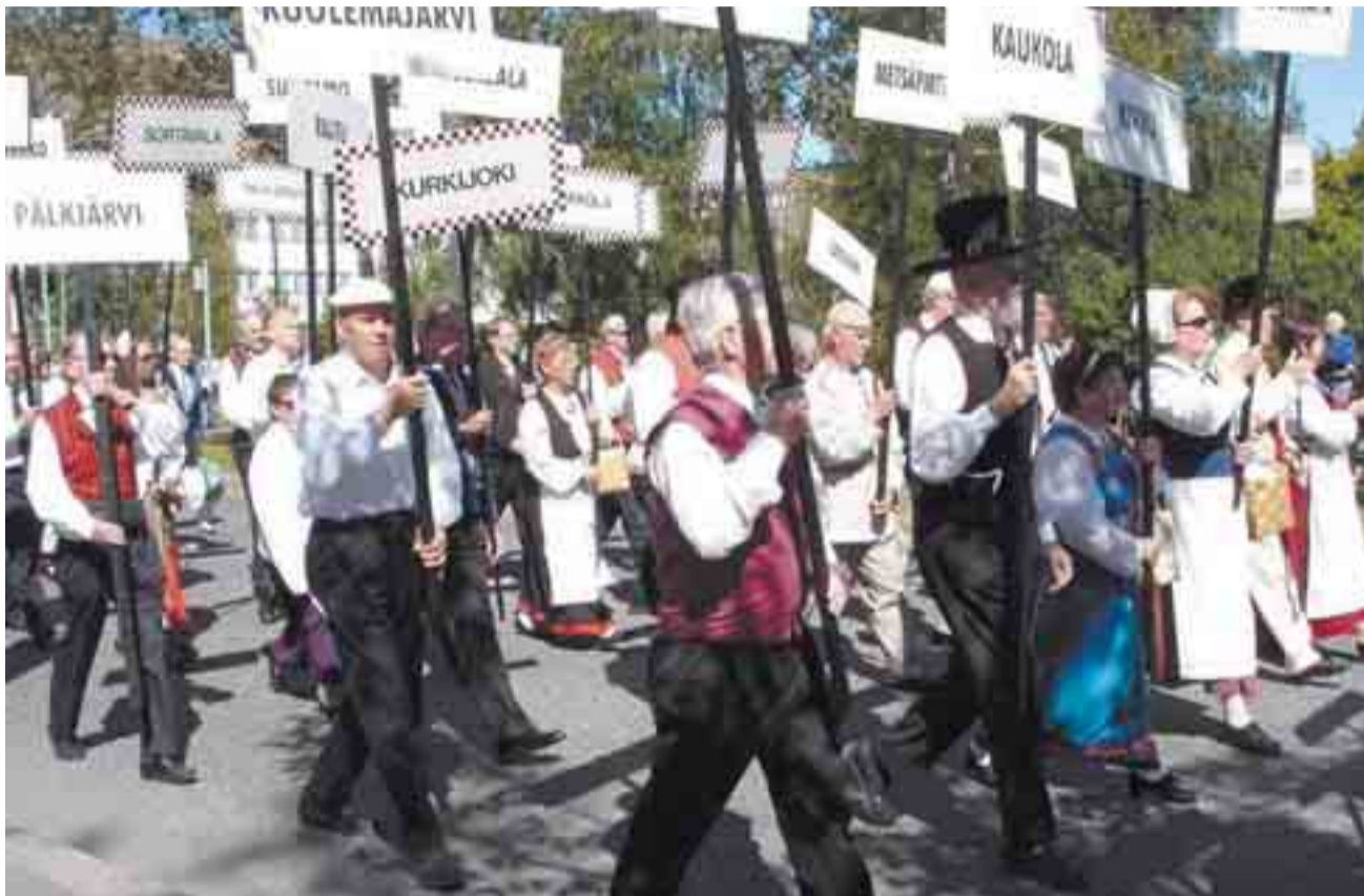
Kuvassa sunnuntain lippukulkueessa hiitolalaiset ja kurkijokelaiset.