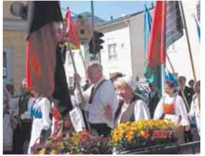
Mukana oli edustajia lähes kaikista luovutetun Karjalan kylistä. Myös Kurkijoki sekä Hiitola olivat edustettuina.