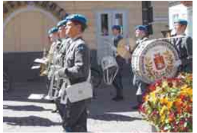
Pohjan Sotilassoittokunnan tahdissa värikäs juhlaväki marssi juhlapaikalle Oulun keskustan katuja pitkin.