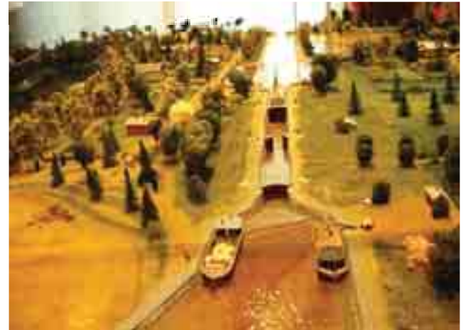
Pienoismalli Saimaan kanavasta ympäristöineen.

Toimitus ja puhelimet KIINNI loman vuoksi 7.-22.6.