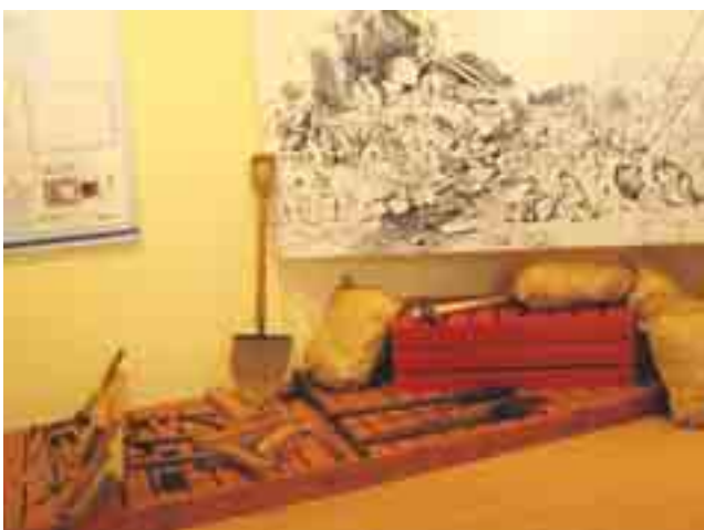
Sisäkuva kanavamuseosta. Esittelyssä olivat niin kanavakennuspöyrökset kuin -työkalutkin.