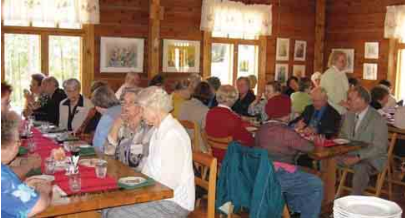
Retkeläiset ovat juuri asettuneet ruokasaliin.