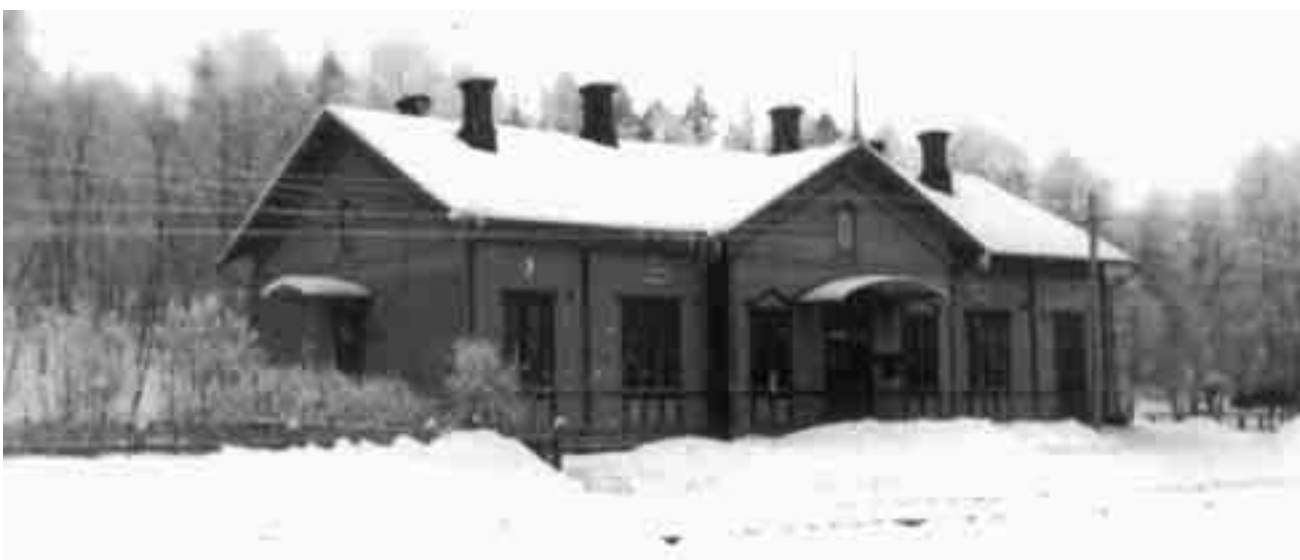
Alhon aseman on kuvannut Viljam Kilpiö. Kuva Ilmi Kärävän kokoelmasta.