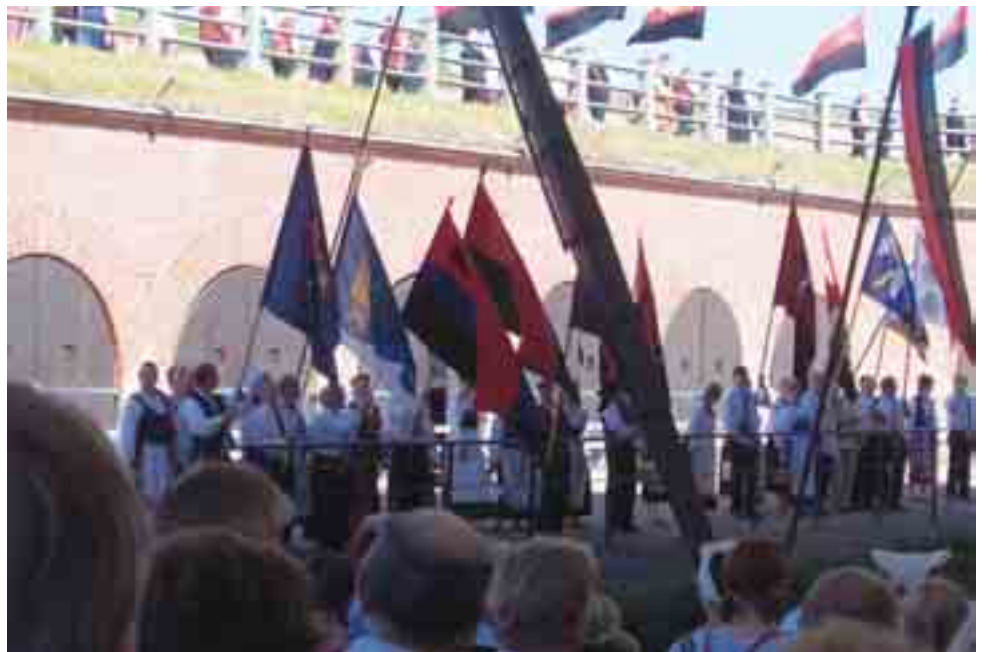
Haminan Karjalaisilla kesäjuhilla liput ryhmittäytyvät Bastionin linnoituksen laidolle. Pelkäästään lippukulkueen näkemisen vuoksi kesäjuhille kannattaa lähteä - kauempaakin, on se niin näyttävä näky.

Juhlapuhuja on puolustusministeri Jyri Häkämies.