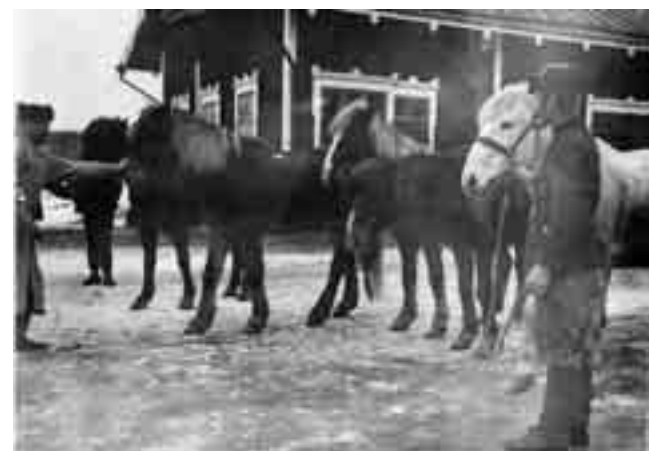
Lopotin markkinoiden ajaksi valittiin maamiesopiston hevospoliisit, jotka ottivat vanhat ja vaivaiset hevoset pois niiden kaupitsijoilta.