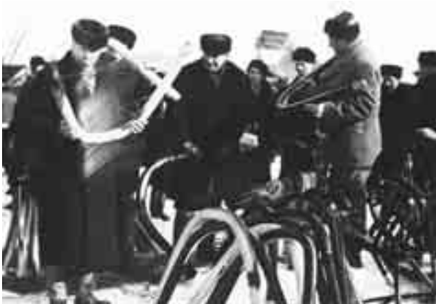
Luokki eli vommel oli myös kuuluisa kotiteollisuuden tuote, jota talvisin valmistettiin puhdetöinä markkinoille vietäväksi. Kuvassa vommelkauppaa 1930-luvulla. Valok. Pekka Kyytinen. Kurkijoki-museon kokoelmat.