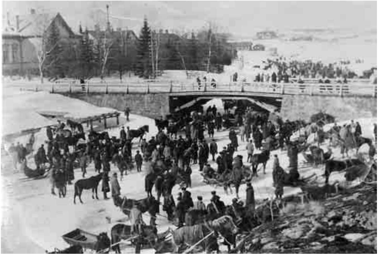
Kurkijoen kaksipäiväiset maalismarkkinat oli merkittävä tapahtuma, jonne kokoontui hevosten ostajia aina Rovaniemeltä asti. Hevoskauppaa käytiin joen jäällä. Vasemmalla maamiesopiston rakennuksia ja opiston silta. Kuva on otettu 1920-luvulla, kuvaaja tuntematon. Kuvan on Kurkijoki-museolle lahjoittanut Kari Rahiala.

Itse Kurkijoki on huomattava hevoskasvattajain pitäjä. Rahvas lähtee joukkolla markkinoille. Kenellä on myytävää, kenellä ostettavaa. Kellä ei ole kumpakaan, hän menee toisia katsomaan ja itseänsä näyttämään tai muuten huvikseen katselemaan "helppoheikkejä", sirkuksia ja muuta markkinahumua. Kaikilla "kynnelle kykenevillä" on perinnäinen tapa käydä markkinoilla. Ja harvapa he-