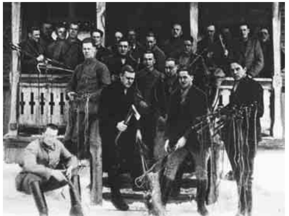
Eläinsuojelutyön tuloksena opiston pojat särkivät kirveellä Kurkijoen markkinoilla takavaroimiaan piiskoja asuntolansa eli kasarmin edessä. Kuva kirjasta Kurkijoen Maamiesopisto 1910–1935.

Ote on J. Koskenrannan kirjoitusta Kurkijoen Maamiesopisto 1910–35 -kirjasta. Otava, Helsinki, 1935.