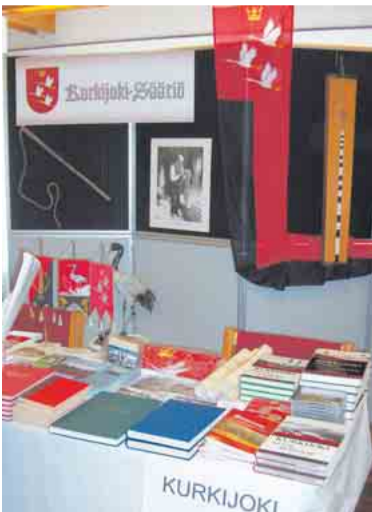
Karjalan Liiton pitäjämessuilla 14.4. Kurkijoen osasto sai kiitosta. Myös uusi juliste oli näyttävä, ja monistetut esitteet loppuivat kesken. Kurkijokelaisen irtonumerot tekivät myös kauppansa.

Karjalan Liiton järjestämällä pitäjämessuilla lauantaina 14.4. Kurkijoki oli erittäin hyvin esillä. Osastossa olivat mukana sekä Kurkijoki-Seura, Kurkijoki-Säätiö, Kurkijokelainen ja Kurkijoen ja Hiitolan sukututkimuspiiri. Yhdessä tehtyä oli mukava esitellä. Ja osasto sai kiitosta.