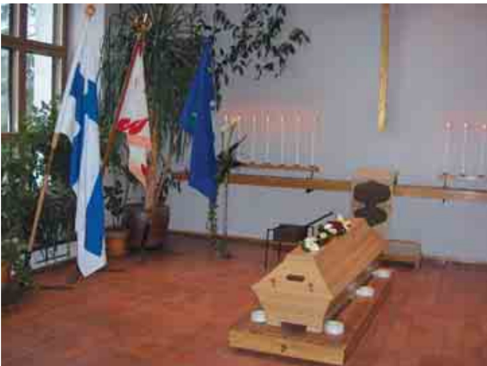
Petter Sairasen arkun äärellä tekivät Suomen, Sotainvalidien ja Sotaveteraanien liput kunniaa.