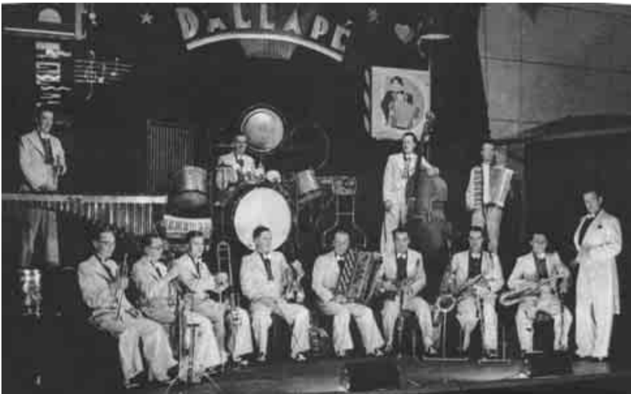
Aikansa huippumuusikoista koostunut orkesteri oli todellinen katseiden vangitsija ja kohahdutti tanssivaa yleisöään smokiasuillaan ja ennennäkemättömällä show-henkisellä esiintymisellään. Kuva on vuodelta 1936.