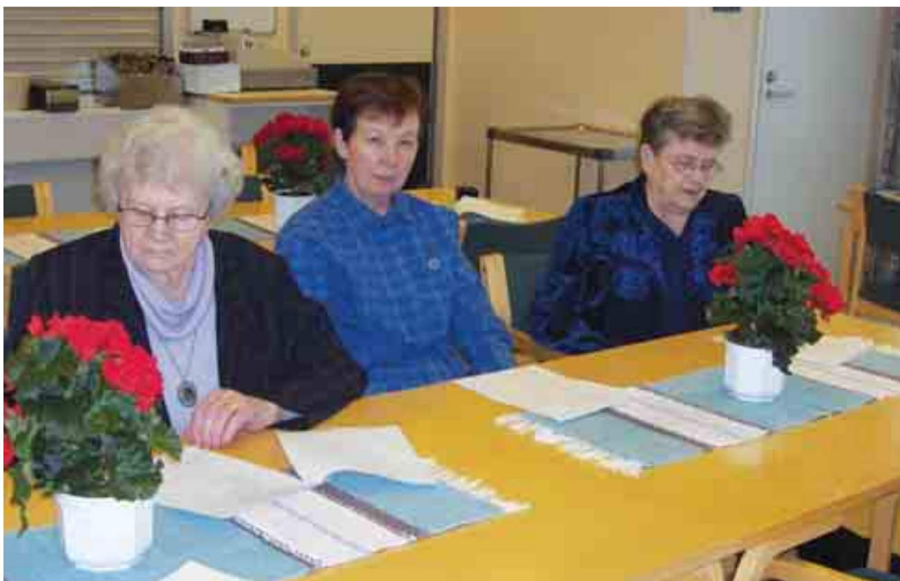
Vuosikokouksessa 18.2.2007 seurattiin kokouksen kulkua tarkkaavaisina ja pohdiskeltiin, mitä uutta Marttaliitto ry:n sääntömuutos tuo tullessaan