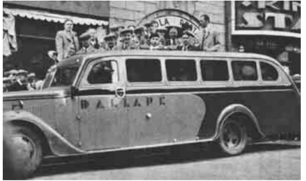
Dallapén päämaja ja harjoitushuoneisto sijaitsi kuuluisassa Heimolan talossa Hallituskadun varrella Helsingissä. Talossa kokoontui Suomen eduskunta vuosina 1911-1930 ja sen suojissa hyväksyttiin myös itsenäisyysjulistus. Se purettiin v. 1969. Tässä yhtye on lähdössä erikoisvalmisteisella Sisubussilla kesäkiertueelle 3.4.1934.

Kauhukuvana on jäänyt mieleeni, kuinka haitarinsoittaja sylkee liekkejä tanssijoita kohti. Sellainen kuva taisi olla jossakin kuvitettuna katekismuksessa. Mutta siitä huolimatta tanssittiin ja niin sanottuja nurkkatanssejakin järjestettiin. Niissä saattoi soida gramofoni tai jokin soittopeli. Ja tietysti läksiäisissä ja häissä tanssittiin haitarin säestyksellä. Dallapén esittämät iskelmät melodioineen ja laulujen sanoineen välittyivät kuultaviksi ja opin ne nopeasti ja osaan monta niistä vieläkin. Joitakin niistä soitetaan yhä lauaintain toivotuissa