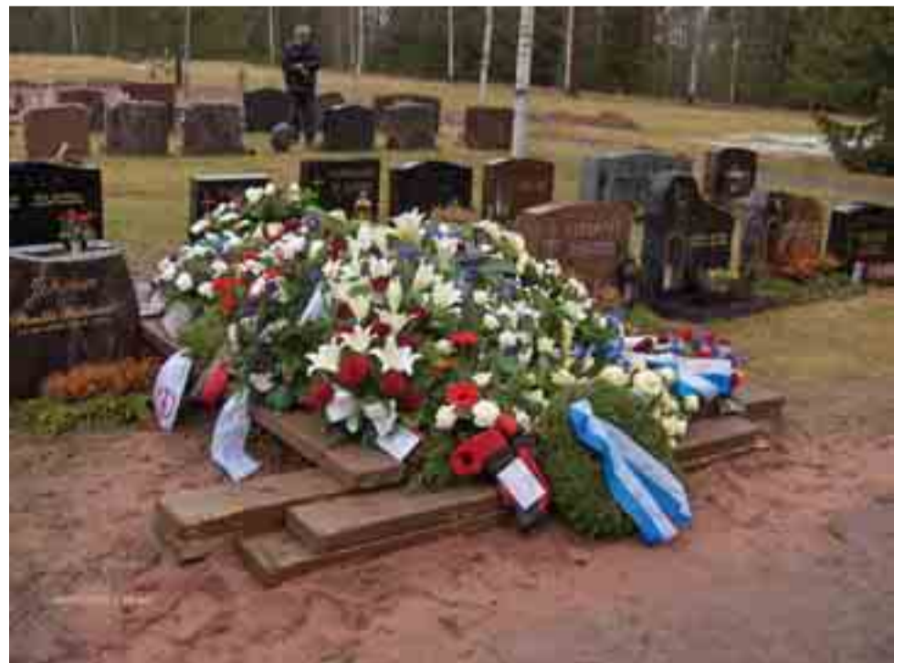
Seppelystä ja kukista täyttynyt Sairasen hautakumpu kertoi tänne jääneiden omaisten ja ystävien kaipuusta ja kunnioituksesta.