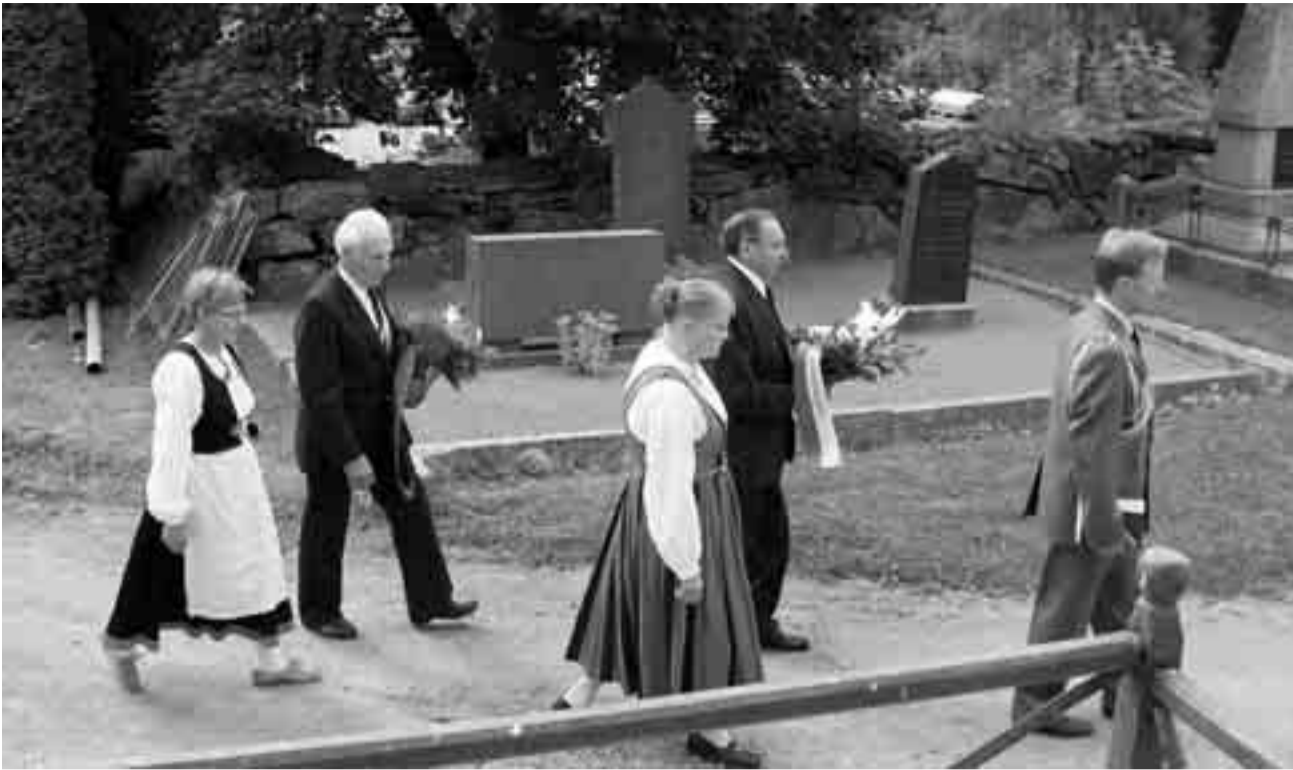
Kurkijokelaisten 60. pitäjäjuhlien yksi kohokohta: muistokukkien vienti Karjalaan jääneiden vainajien muistokivelle Kanta-Loimaan kirkkomaalla.