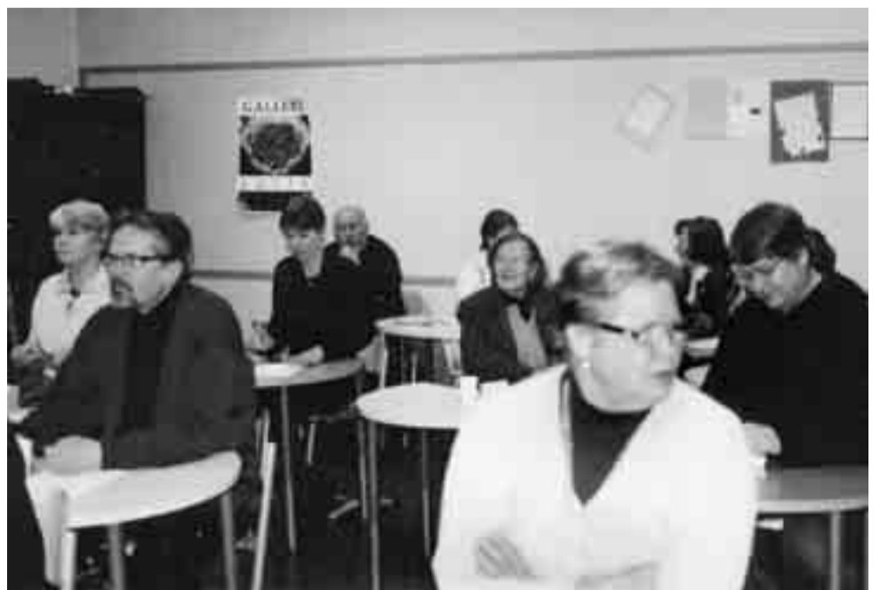
Historiaa maan alla ja maan päällä –luennon yleisöä. Karjala ja Karjalan historia kiinnostaa lappeenrantalaisia.