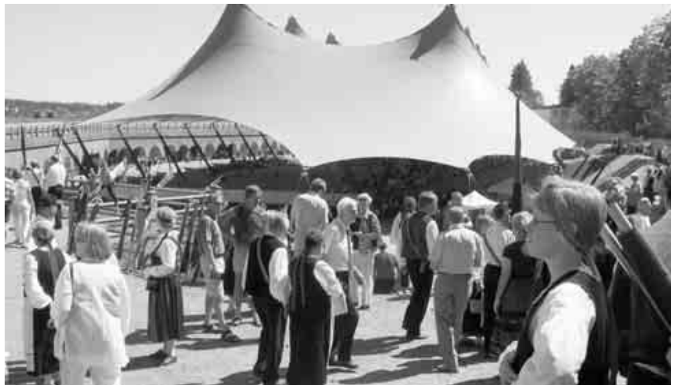
Haminan Bastioni oli hieno paikka järjestää Karjalaiset kesäjuhlat.