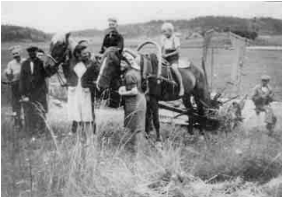
Rukiinleikkauksessa ja -puinnissa tarvittiin paljon väkeä, jonka takia tilalle oli saatu työvelvollisuutta suorittavia naisia.