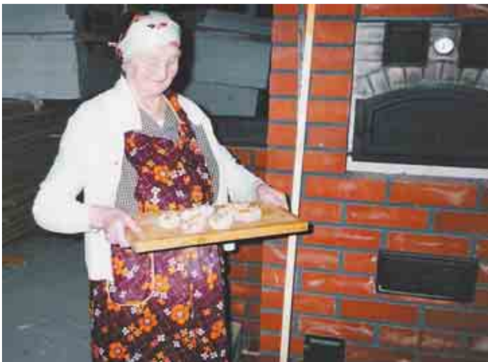
Hilja-mummo oli taitava piirasta tekemä. Piirastat maistuivat herkullisilta. "A nythä myö käyvää piirasta tekemää", oli mieluista kuultavaa lastenlapsillekin.