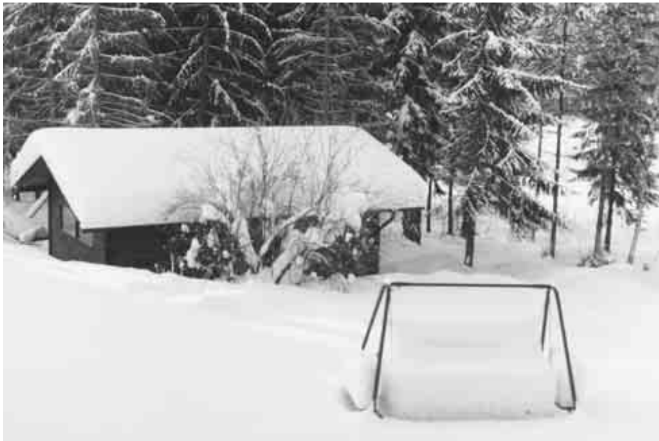
Onhan niitä ollut kunnan talvia Etelä-Suomen länsirannikollakin. Kuva on otettu Noormarkussa 1980-luvulla.

21.2. Joka luulee seisovansa, katsokoon, ettei kaadu. Teitä kohdannut kiusaus ei ole mitenkään epäta- vallinen. Jumalaan voi luottaa. 1. Kor. 10:12-13