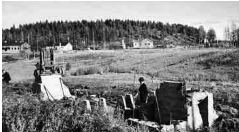
Toivo Pölkkin omistaman myllyn ja raamisahan jäänteet syksyllä 1941. Vasemmassa laidassa on Alhon silloinen asema, jonka venäläiset siirsivät Elisenvaaran asemaksi. Kuvaaja Pekka Kyytinen. Kuva lienee nykyisin Kurkijoki-museossa.