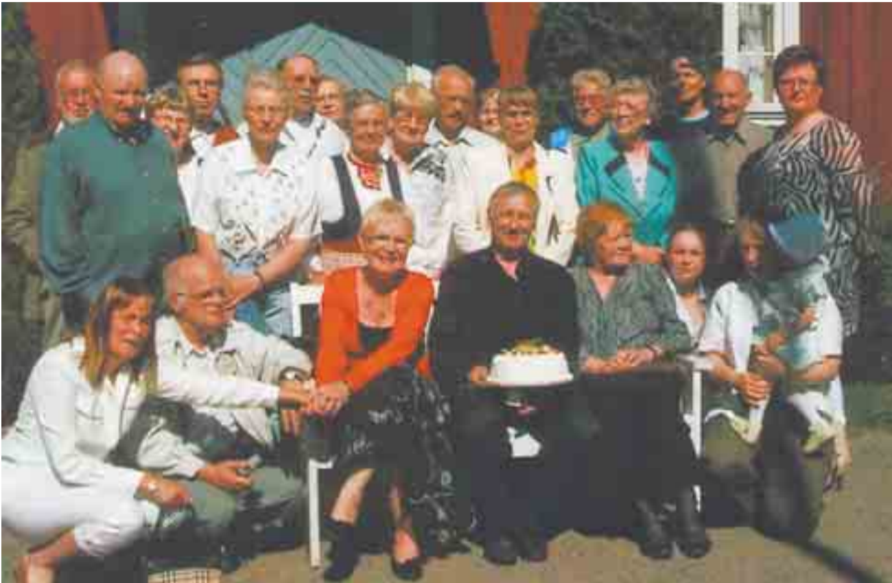
Yhteiskuvaan kokoontuimme tietenkin, jotta saatiin muisto vuoden 2007 vuosikokouksesta. Täytekakku pääsi myös kuvaan, väikkeitä seuraan kuulukaan.