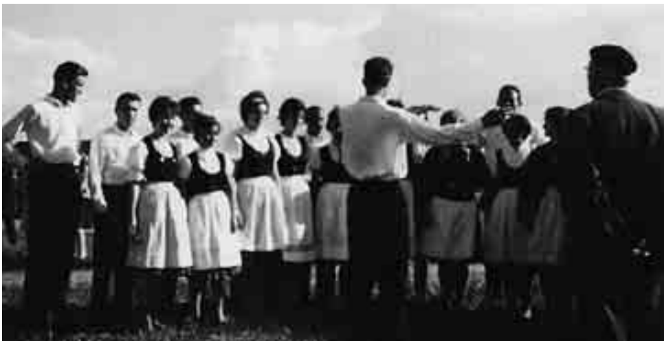
Saksalaisia vieraiden kuoro esiintyy pitäjänjuhlassa Vampulassa v. 1962