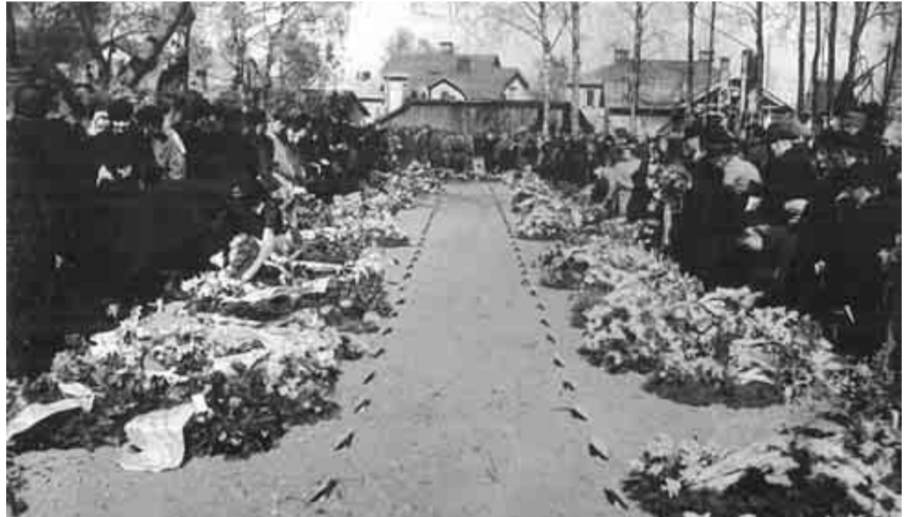
Sankarivainajien haudoilla Lappeenrannassa v. 1940.