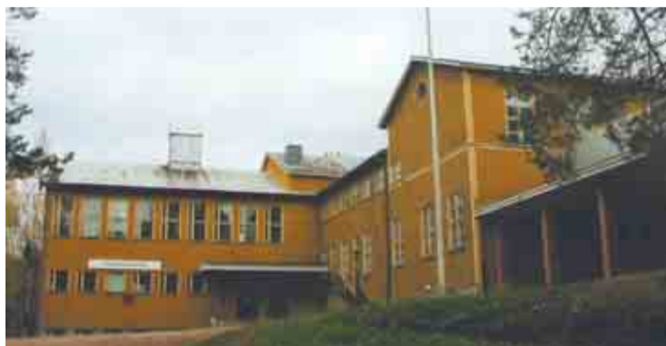
Kukkula, entinen suojeluskuntatalo, jossa myös Elisenvaaran yhteiskoulu toimi.